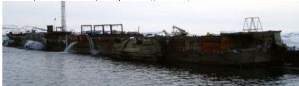
В 2002 году частично разобран, после чего затонул в акватории поселка Белокаменка в Кольском заливе. В марте 2006 утилизирован.