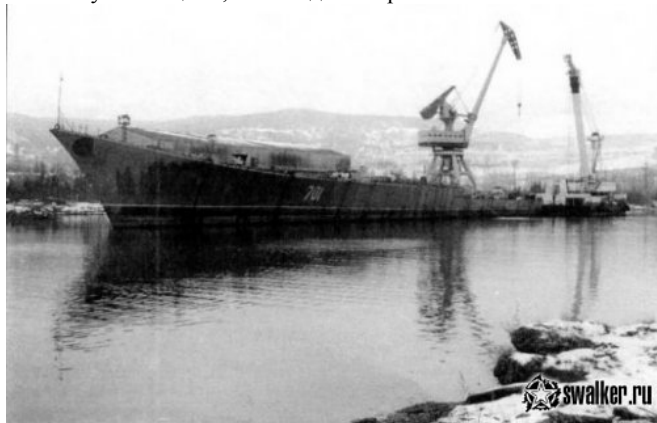
ЧФ РФ. БПК «Азов». На утилизации, 2002 год. Инкерман.