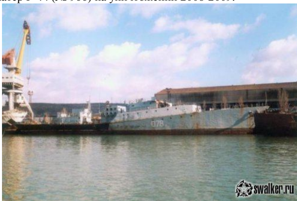
ЧФ РФ. МПК-127 «Альбатрос».

Был выведен из состава флота в 2005 году, в том же году разобран на металл в Инкермане.