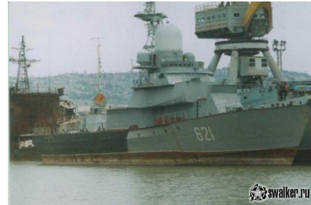
ЧФ РФ. МРК «Зарница». Был выведен из состава флота в 2005 году. Разобран на слом в Инкермане на судоразделочной базе в марте-апреле 2006 года.