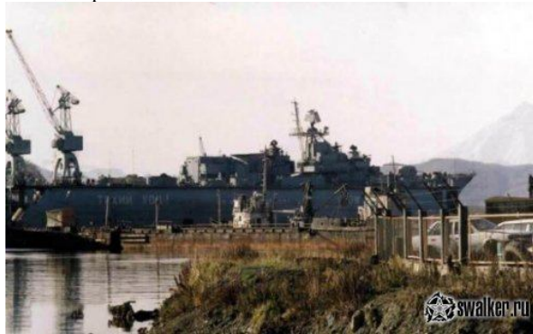
Пограничный сторожевой корабль «Кедров». В сухом доке. 28 февраля 2003 года корабль уведен с Камчатки для разделки в Китай.

«Псков» на частичном демонтаже в бухте Бабя, 26 октября 2002 года. 28 февраля 2003 года корабль уведен с Камчатки для разделки в Китай.