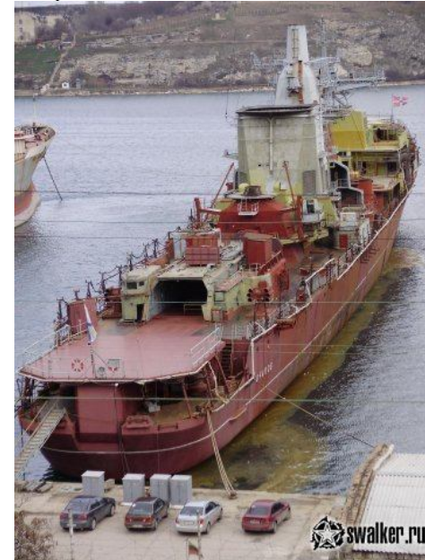
Большой противолодочный корабль «Очаков». ЧФ РФ