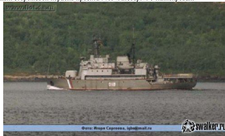
Пограничный сторожевой корабль проекта 97П «Айсберг». Утилизирован.