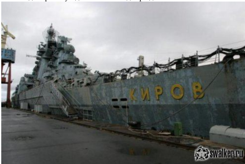
Тяжёлый атомный ракетный крейсер «Адмирал Ушаков» (бывший «Киров»). Стоит в Северодвинске у причала оборонной верфи «Звездочка» в ожидании утилизации.