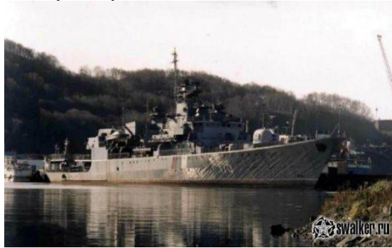
Пограничный сторожевой корабль пр. 11351 «Псков».

«Псков» на частичном демонтаже в бухте Бабя, 26 октября 2002 года. 28 февраля 2003 года корабль уведен с Камчатки для разделки в Китай.