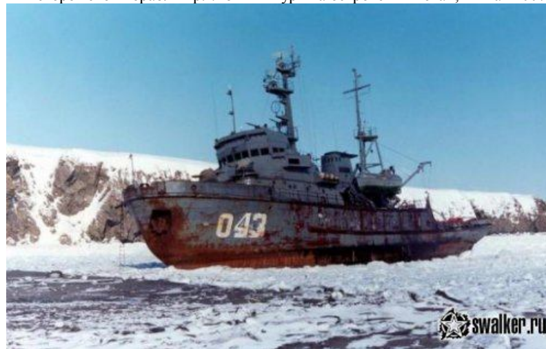
Снят с мели, утилизирован. Так мы охраняем Курилы.