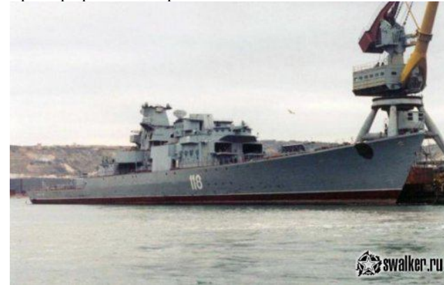
В ноябре 2002 года на крейсере спущен российский военно-морской флаг. Утилизация в Инкермане.