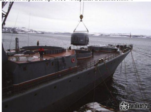
11 декабря 2006 года на корабле спущен военно-морской флаг. Демонтаж орудий и утилизация.