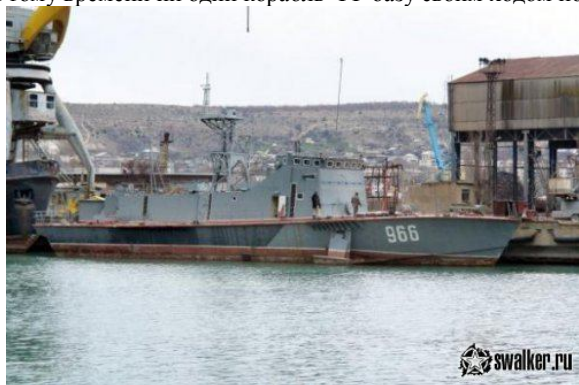
ЧФ РФ. Ракетный катер Р-44 (№ 966) на уничтожении 2008-2009.

Морской тральщик ЧФ РФ «Снайпер». Инкерман, на утилизации, 2006 год. Корреспондент у одного офицера ЧФ (фамилию не помню) спрашивает, мол, в 2017 году истекает срок аренды Россией базы в Севастополе, что будем делать? А тот и отвечает: «К тому времени ни один корабль ЧФ базу своим ходом покинуть не сможет».