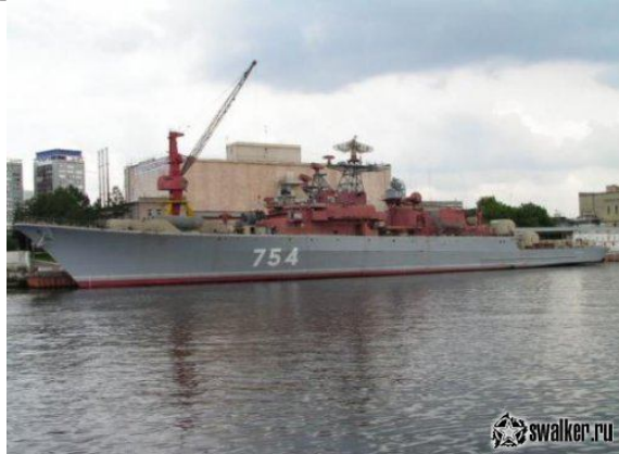
Большой противолодочный корабль пр. 1155 «Маршал Василевский».